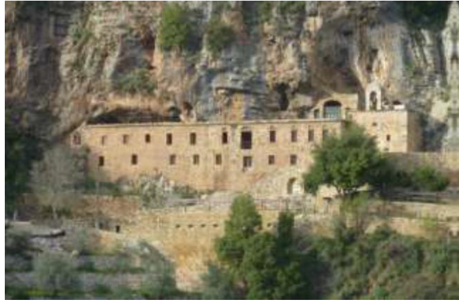
دير مار ليشع