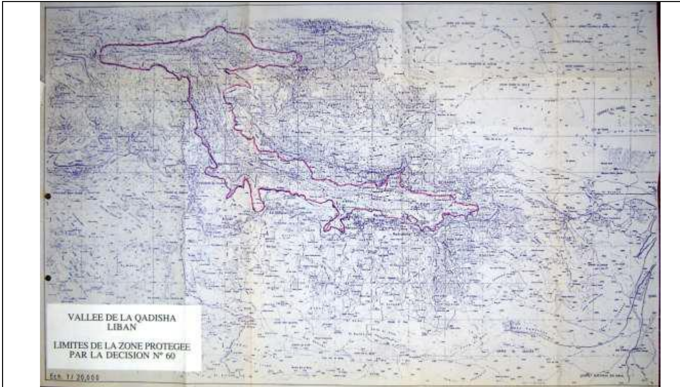
المنطقة المصنفة على لائحة التراث العالمي