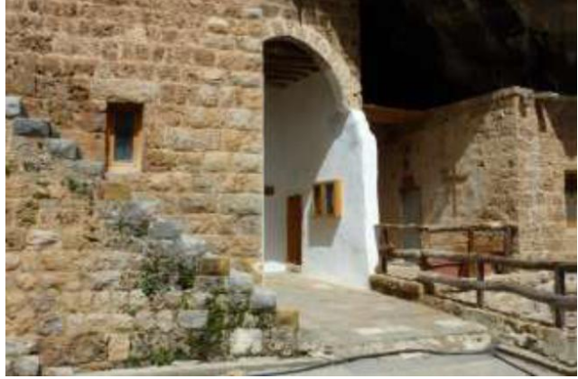
دير سيدة قنوبين