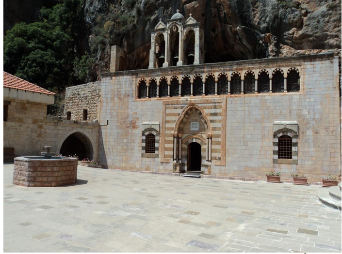
دير مار أنطونيوس قزحيا