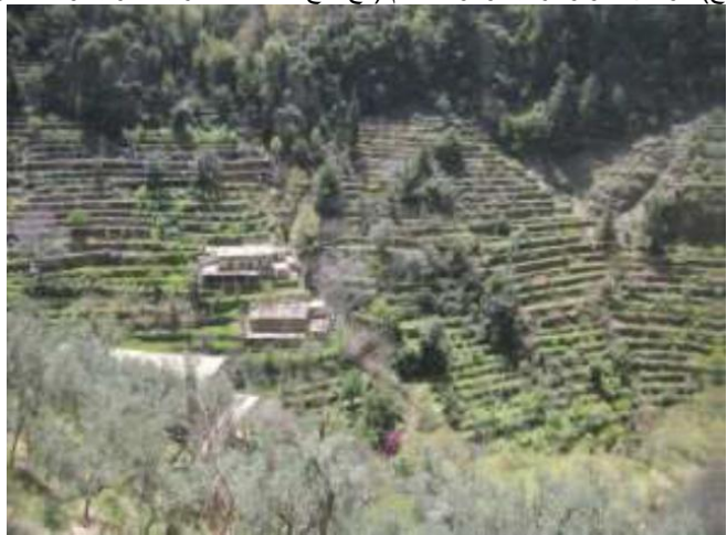
الجلال الزراعية في الوادي

ج) الوثائق الفوتوغرافية و/أو الأفلام (مع منح المنظمة العربية للتربية والثقافة والعلوم، حق استخدام الصور والأفلام ومقاطع الفيديوها)