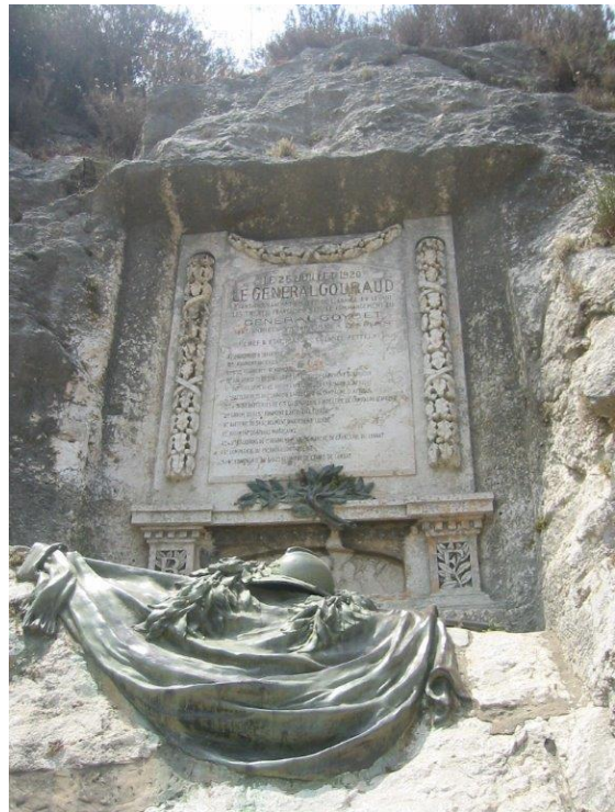
صورة من اللوحات التذكارية المنقوشة