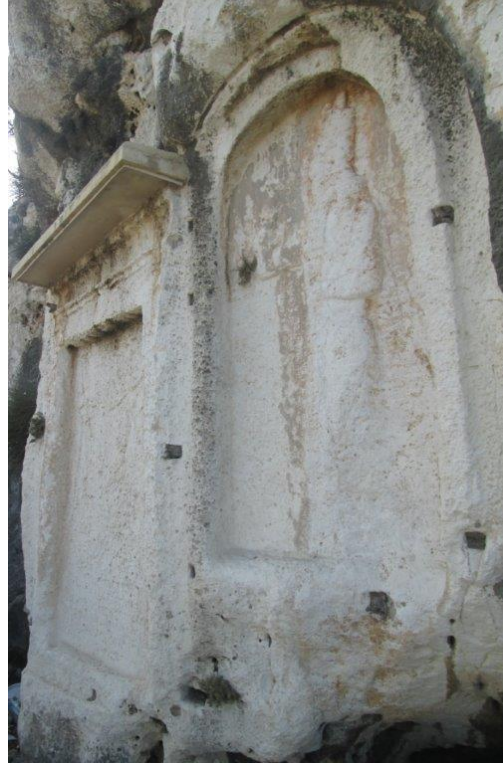
صورة من اللوحات التذكارية المنقوشة