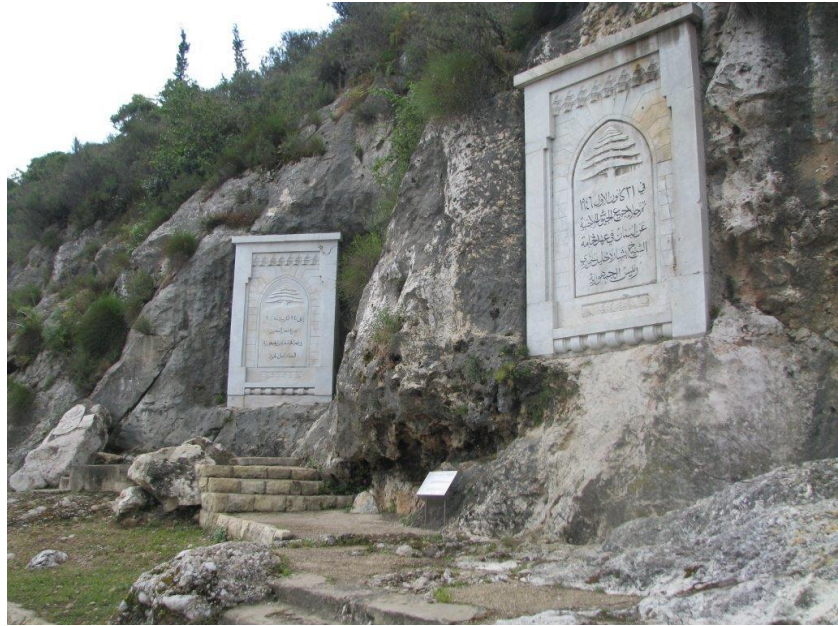
صورة من اللوحات التذكارية المنقوشة