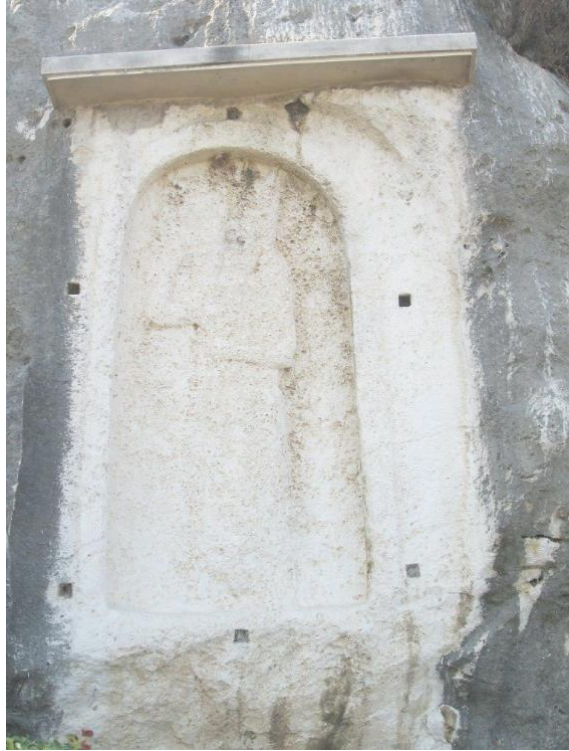
صورة من اللوحات التذكارية المنقوشة