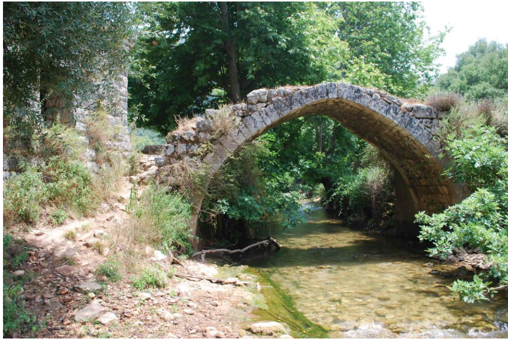
جسر قرب طاحون بطرس