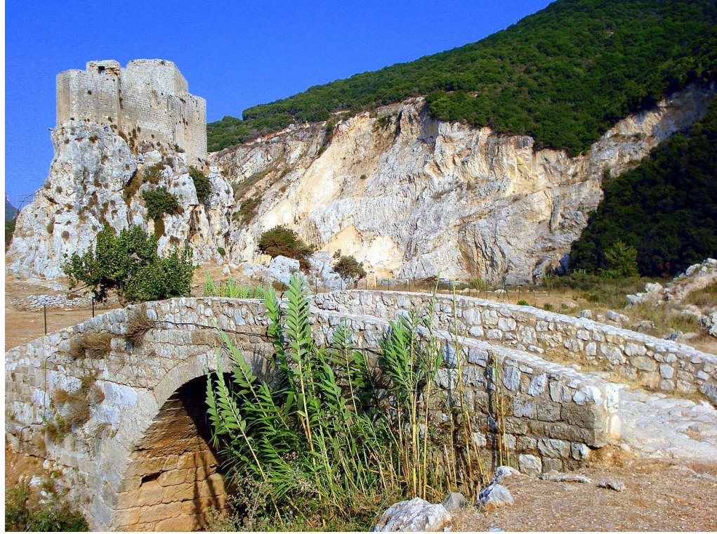
قلعة وجسر المسيلة

ج) الوثائق الفوتوغرافية و/أو الأفلام (مع منح المنظمة العربية للتربية والثقافة والعلوم، حق استخدام الصور والأفلام ومقاطع الفيديوها)