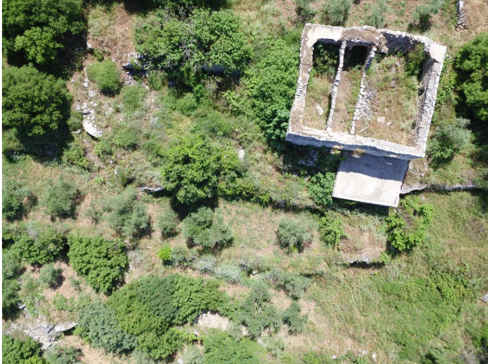
مبنى أثري مهجور

(د) لمحة تاريخية: لقد أكدت الدراسات العلمية أن الحياة في منطقة نهر الجوز قد بدأت منذ عصور ما قبل التاريخ. فقد وثق العالمان كوبلند ووستكومب سنة ١٩٦٦ على خريطة نهر الجوز، موقعاً قرب منطقة كفتون يعود إلى العصر الباليوليتي . وقد قام فريق أثري إثر إجراء مسح أثري لمنطقة نهر الجوز سنة ٢٠١٦ تحت إشراف المديرية العامة للآثار، بالتقاط عدد من القطع الصوانية التي تعود إلى العصر