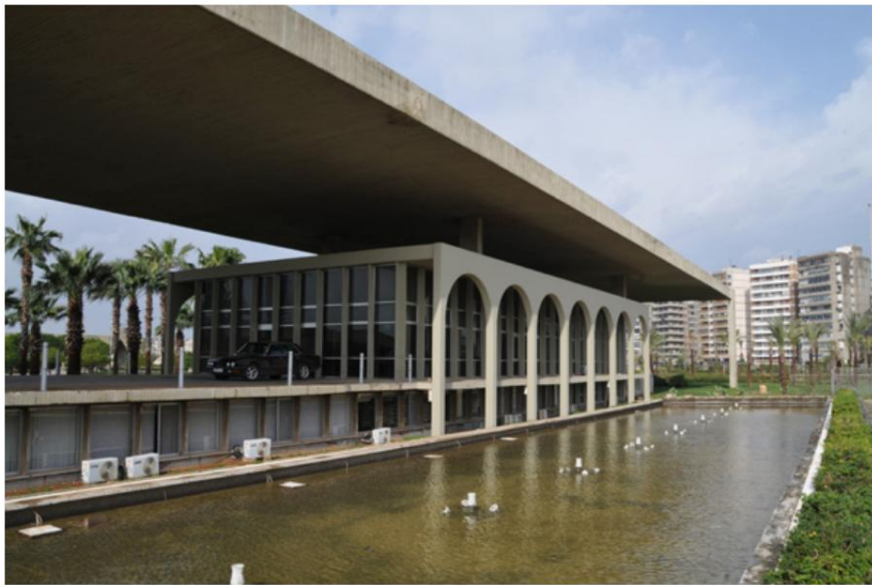
المكاتب ومركز الأعمال