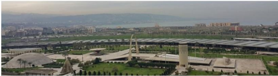
صالة العرض المقللة