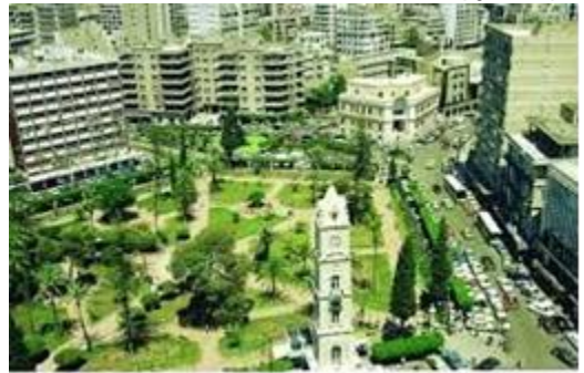
منظر عام للمدينة - ساحة النل