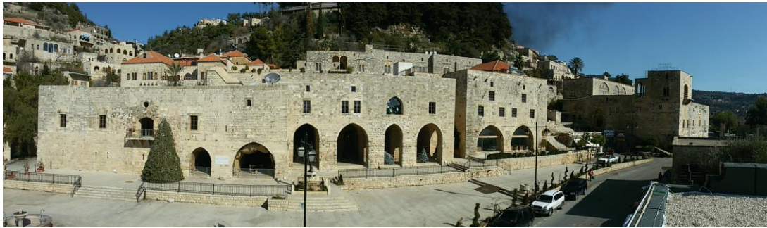
ساحة الميدان وقصر الأمير فخر الدين المعني الثاني والخرج والقبصريّة