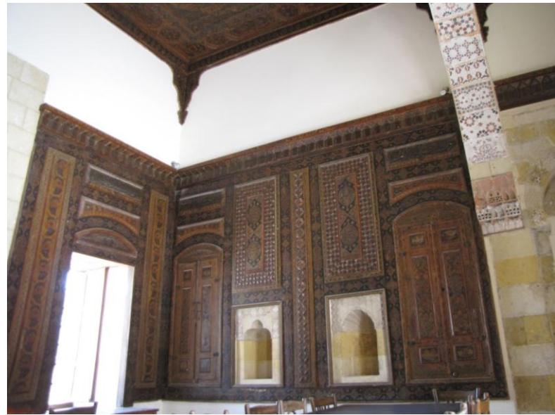
سرای الأمير يوسف الشهابي