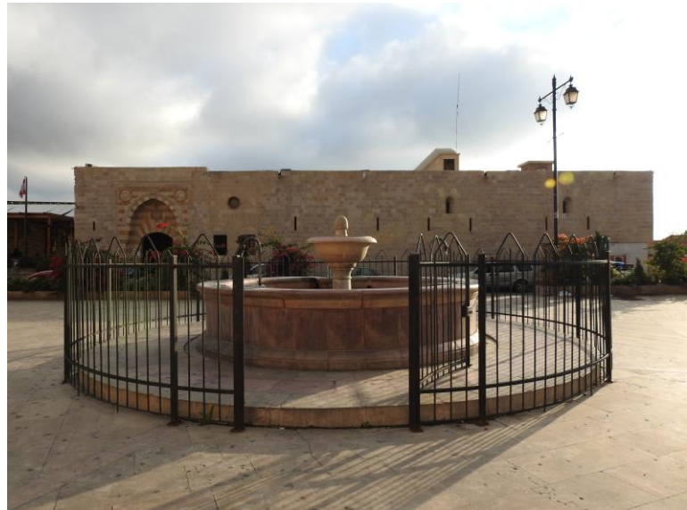
سبيل ساحة الميدان وسراي الأمير يوسف الشهابي في الخلف