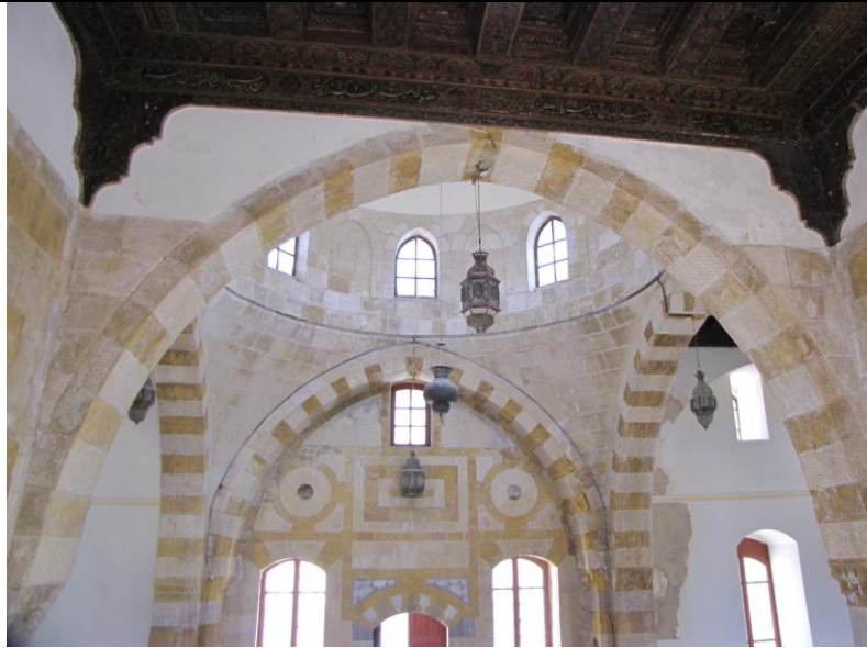
سرای الأمير يوسف الشهابي