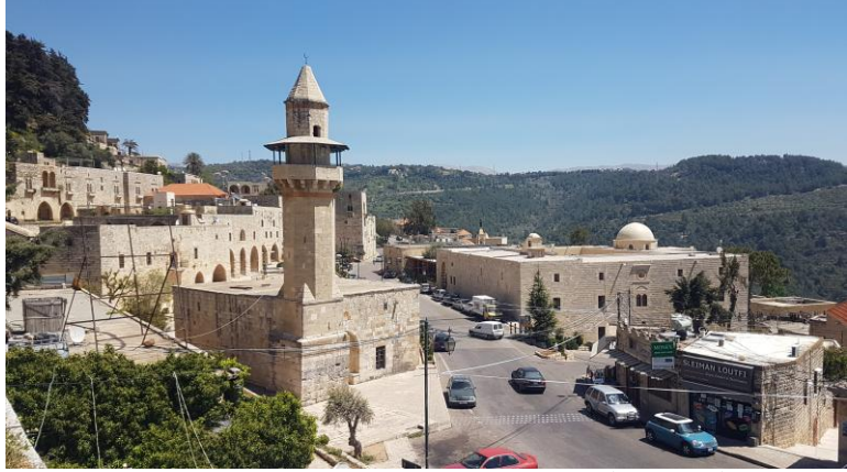
صورة عامة لساحة دير القمر

ج) الوثائق الفوتوغرافية و/أو الأفلام (مع منح المنظمة العربية للتربية والثقافة والعلوم، حق استخدام الصور والأفلام ومقاطع الفيديوهات)