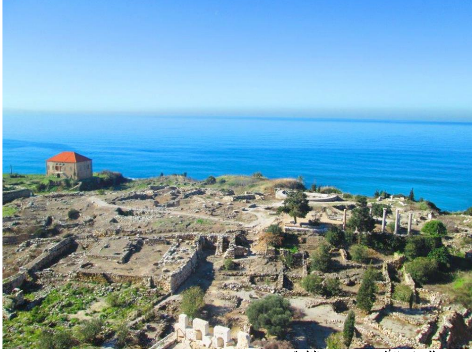
صورة للموقع الأثري من برج القلعة

ج) الوثائق الفوتوغرافية و/أو الأفلام (مع منح المنظمة العربية للتربية والثقافة والعلوم، حق استخدام الصور والأفلام ومقاطع الفيديوها)