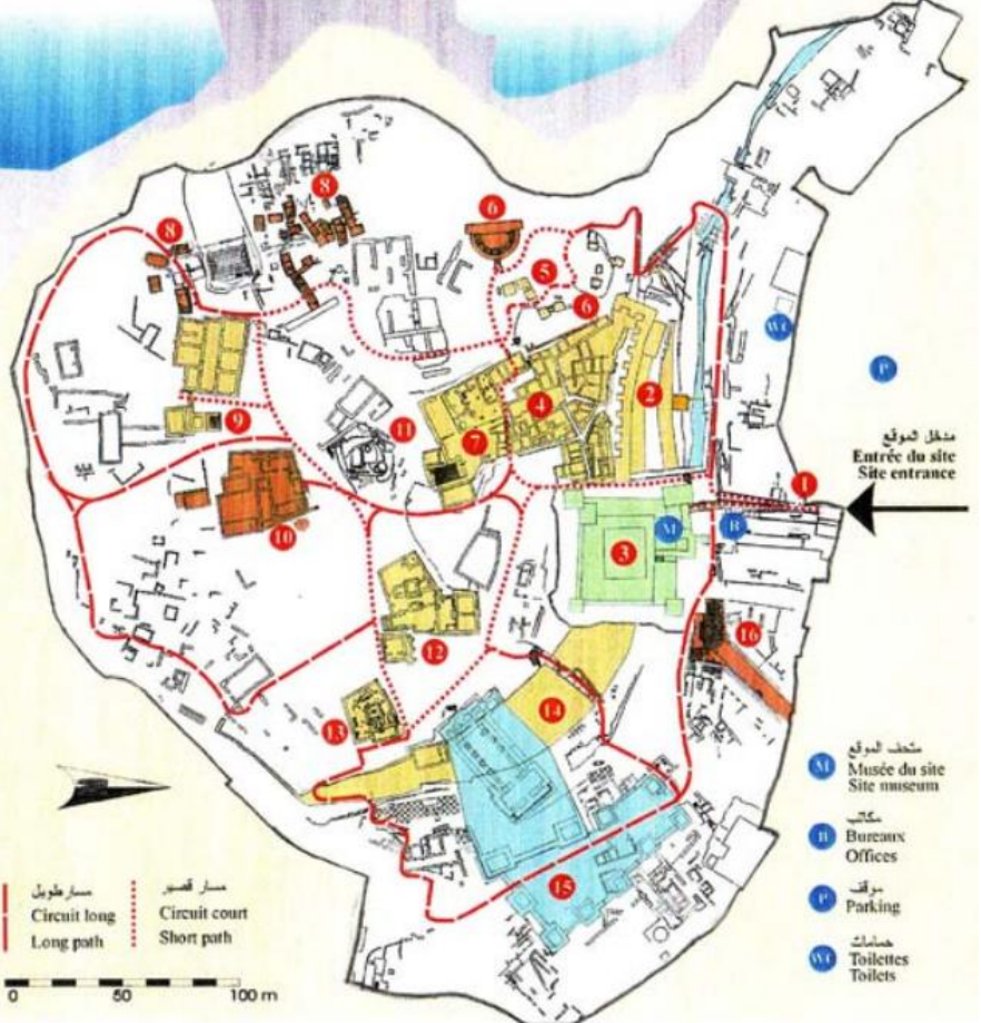
مخطط الموقع الأثري