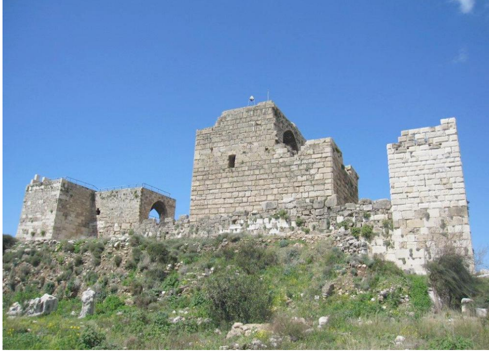
صورة للقلعة الصليبية