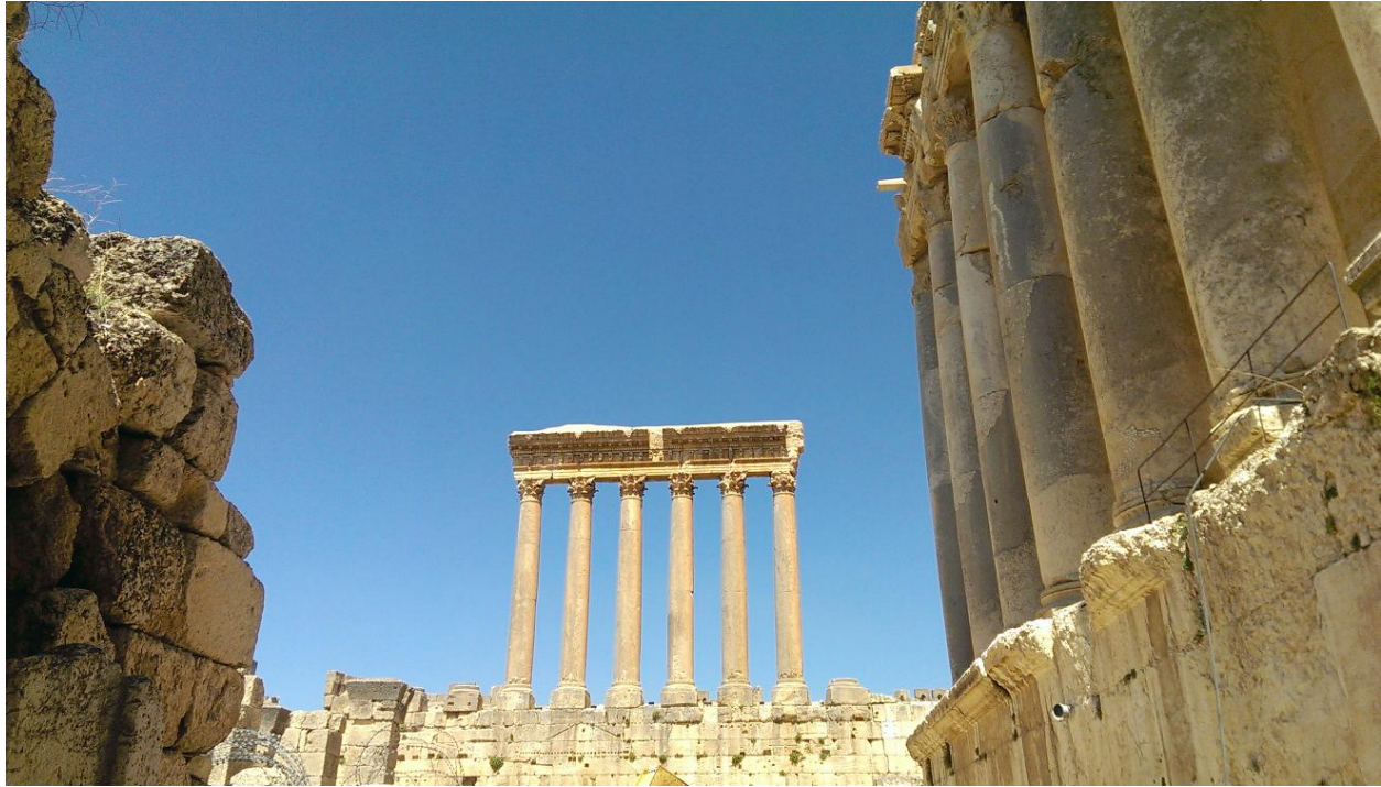
صورة لعماميد معبد جوبيتر

ج) الوثائق الفوتوغرافية و/أو الأفلام (مع منح المنظمة العربية للتربية والثقافة والعلوم، حق استخدام الصور والأفلام ومقاطع الفيديو)