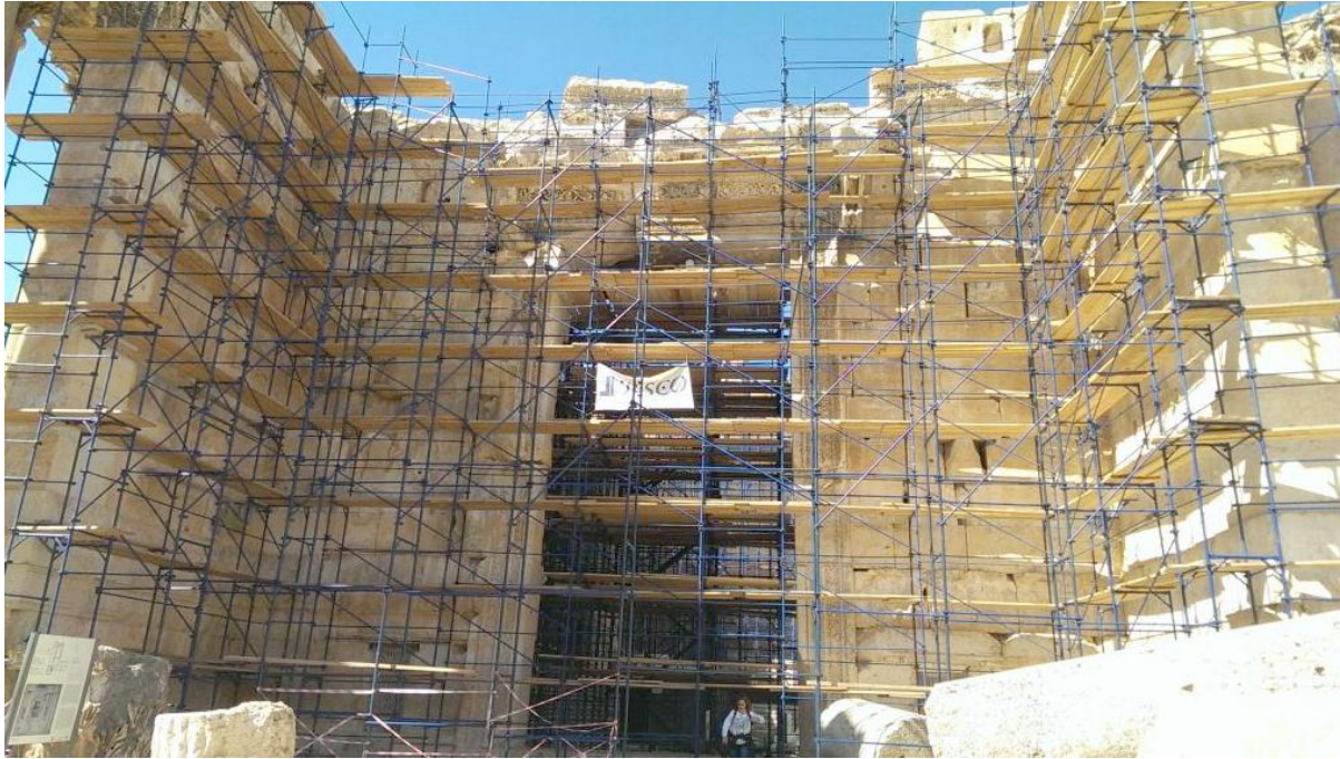
صورة لمعبد باخوس خلال أعمال الترميم