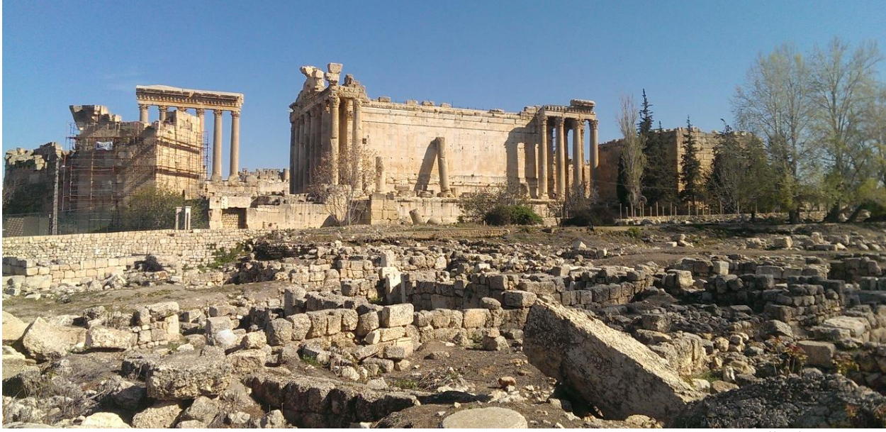
صورة إجمالية للموقع